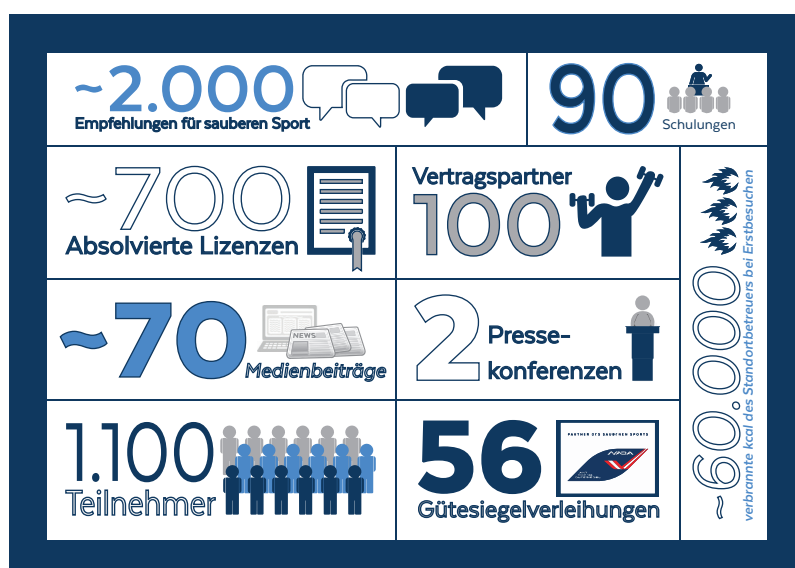
Kurzer Überblick zum Status des Gütesiegels:

skrupellose Fälscherbanden das Internet als Umschlagplatz für die illegale Ware, beispielsweise Produkte, die unter schlimmsten hygienischen Bedingungen hergestellt werden.